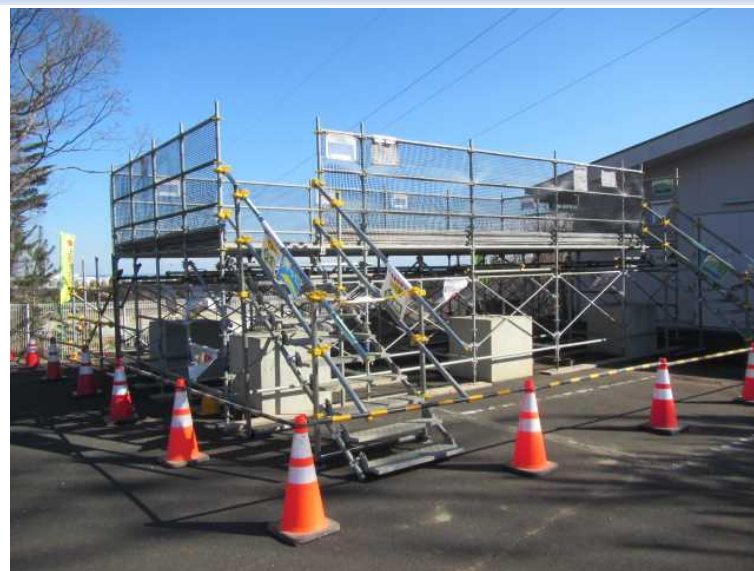
仮設展望台から土壌貯蔵施設等をご覧いただけます。