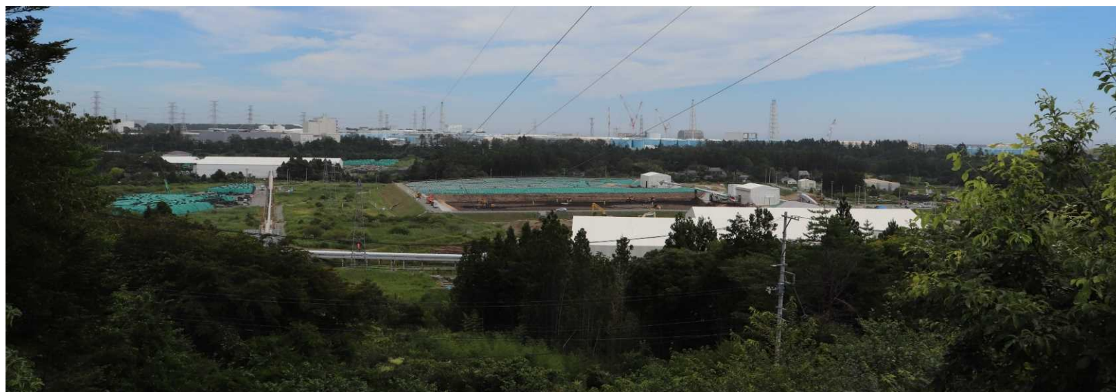
サンライトおおくまからの眺望