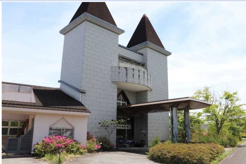
サンライトおおくまの外観