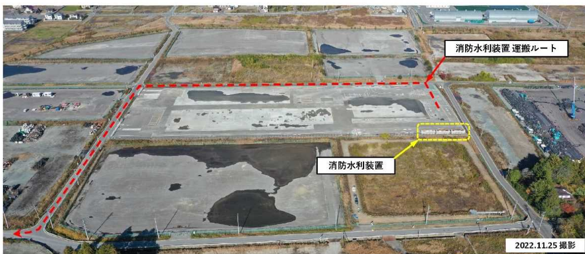
写真①：（ドローン斜角撮影）