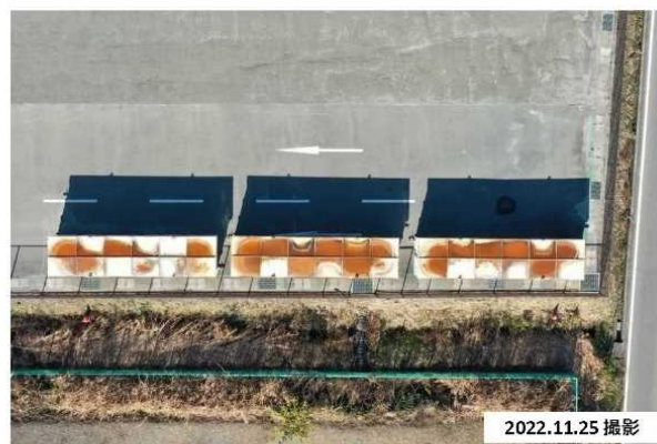
写真③：（ドローン直上撮影）