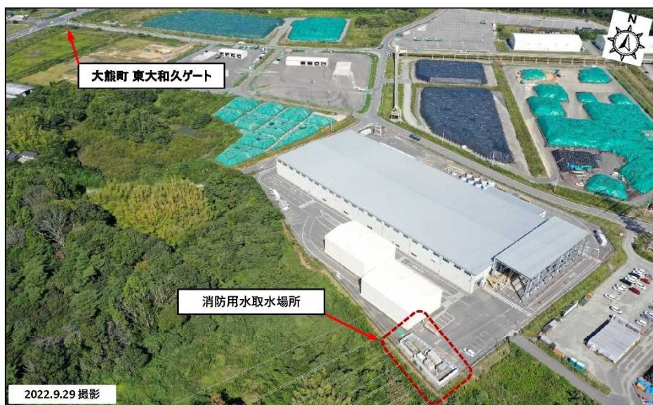
写真①：(ドローン斜角撮影)