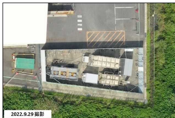
写真③：(ドローン直上撮影)