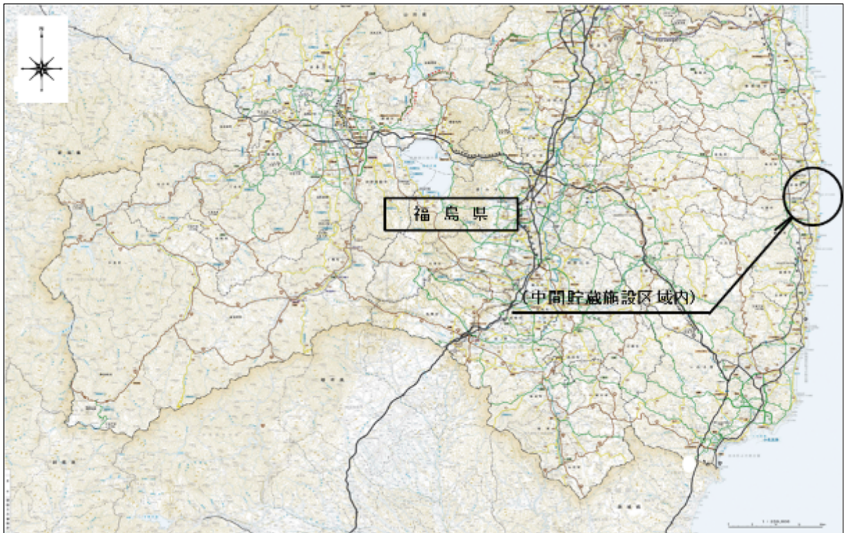
図1. 位置図 (中間貯蔵施設)