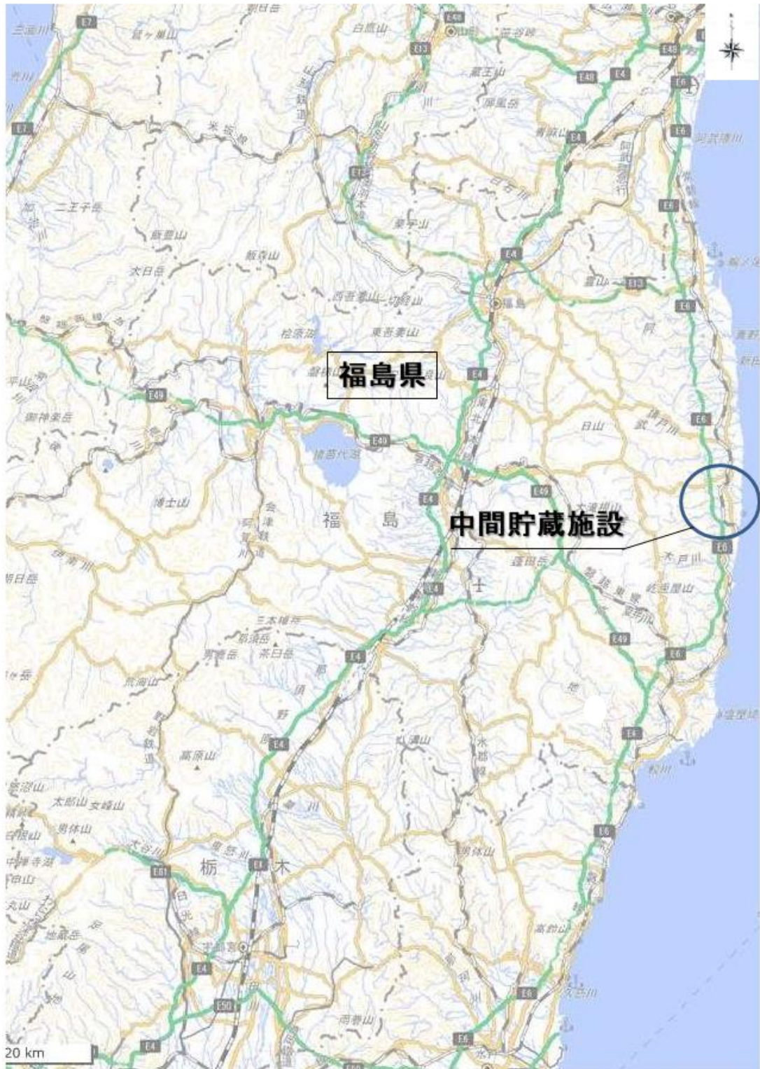
図1. 位置図（中間貯蔵施設）