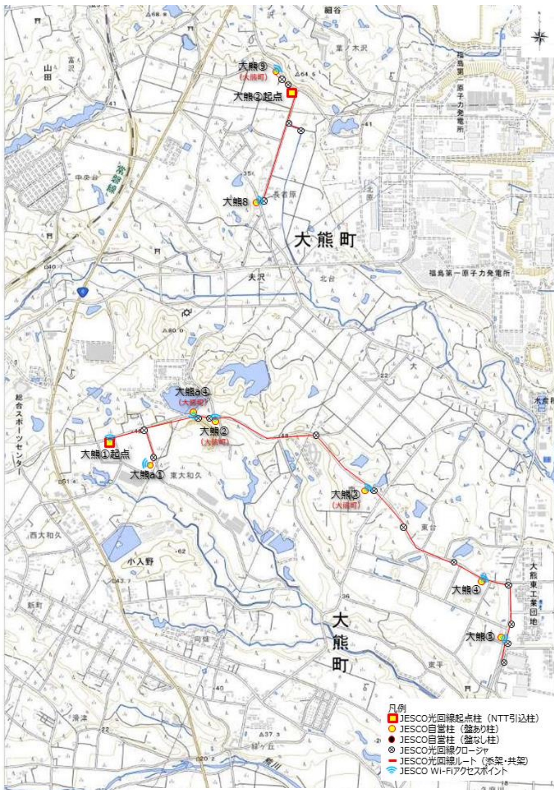
図2. 設置箇所位置図 (大熊町)