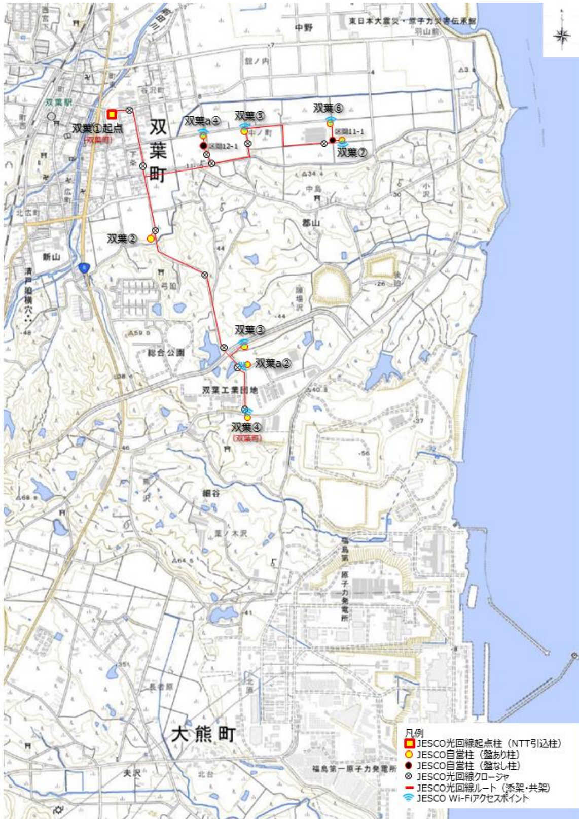
図3. 設置箇所位置図（双葉町）