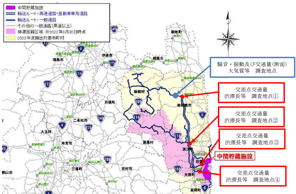
図1 調査地点概略図