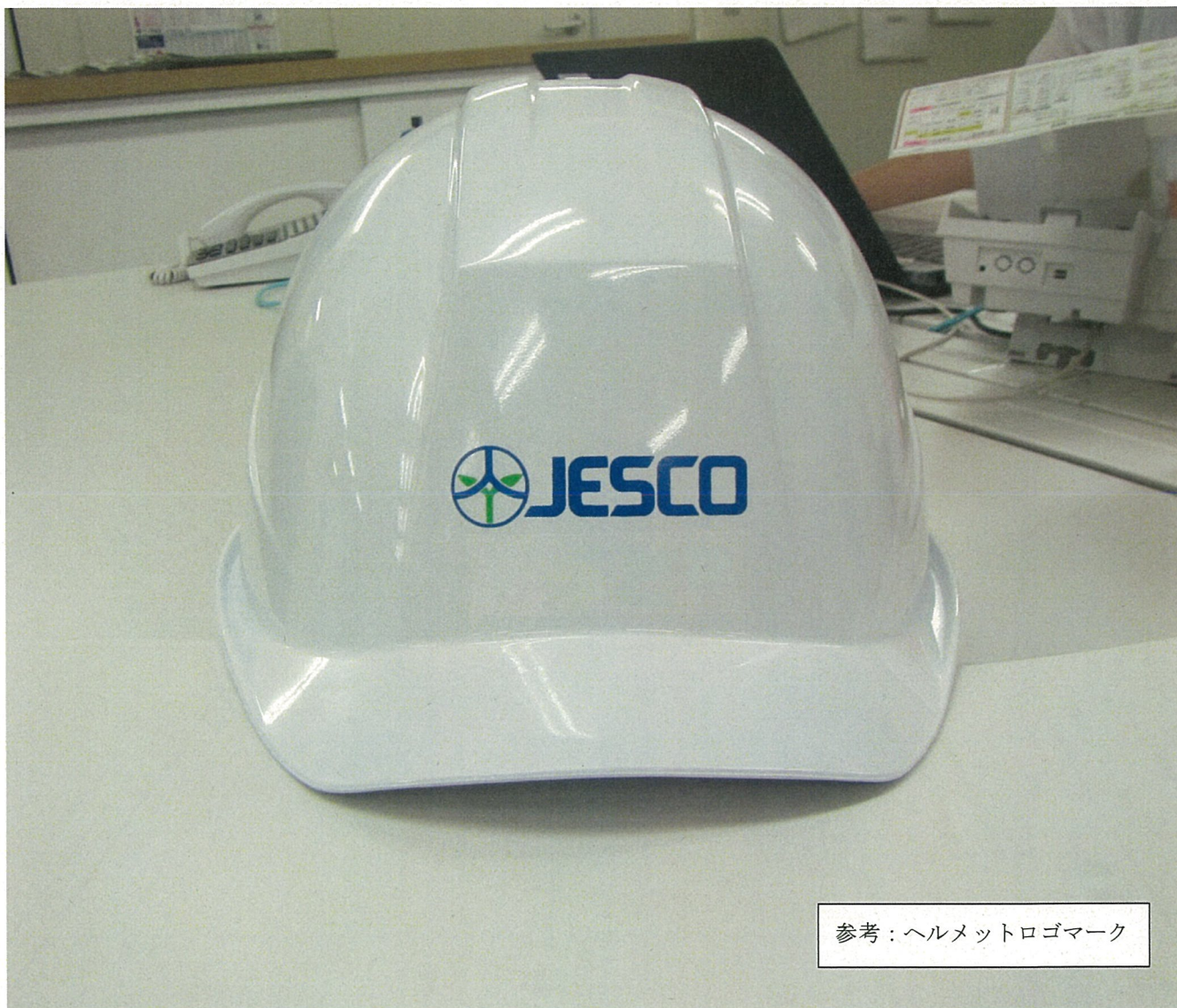
参考：ヘルメットロゴマーク