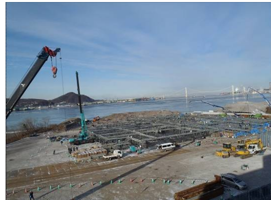
平成 24 年 1 月末時点（基礎工事中）