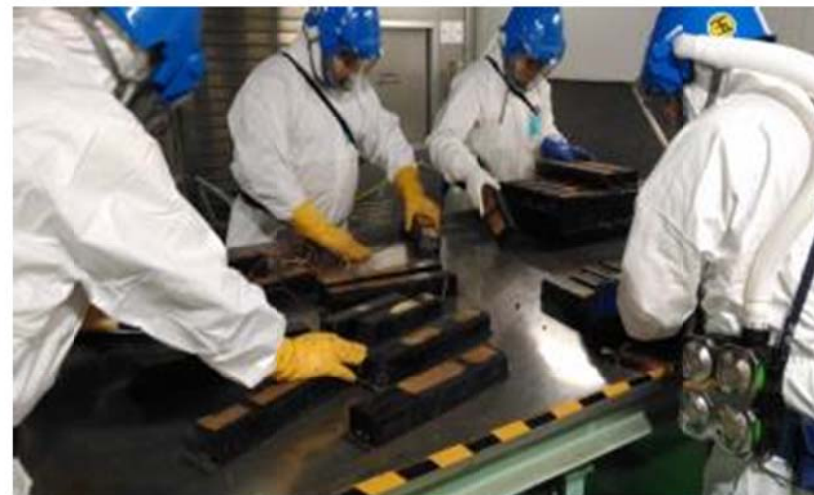
作業員による仕分け作業