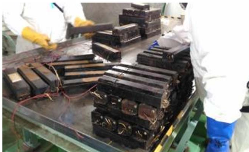
種類ごとに分類された廃安定器