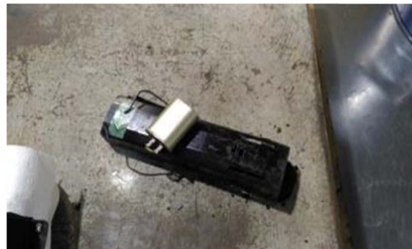
コンデンサ外付け型安定器本体と そこから取り外されたコンデンサ