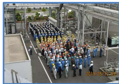
定期点検安全大会

JESCO 社員及び運転会社社員、点検・整備にあたる工事請負会社などの関係者が集合し、JESCO 所長による安全訓示、工事請負責任者による安全宣言などで、注意喚起と安全意識の高揚を図りました。