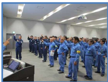
安全週間安全大会

全国安全週間（7月1日～7日）を迎えて、7月1日にJESCO 社員及び運転会社社員による令和元年度安全大会を開催しました。