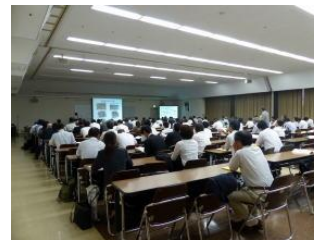
講演会・セミナー