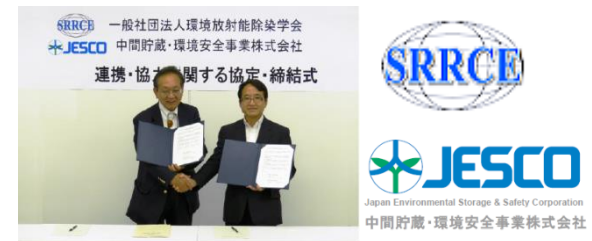
JESCOとの連携・協力協定締結