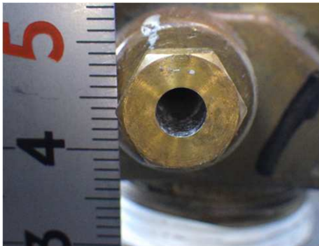
冷媒回収ポンベ 可溶栓が溶解