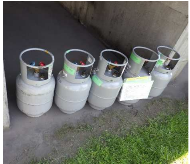
冷媒回収ポンベ 屋外搬出後状況