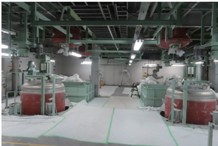
液処理室タンク保温撤去