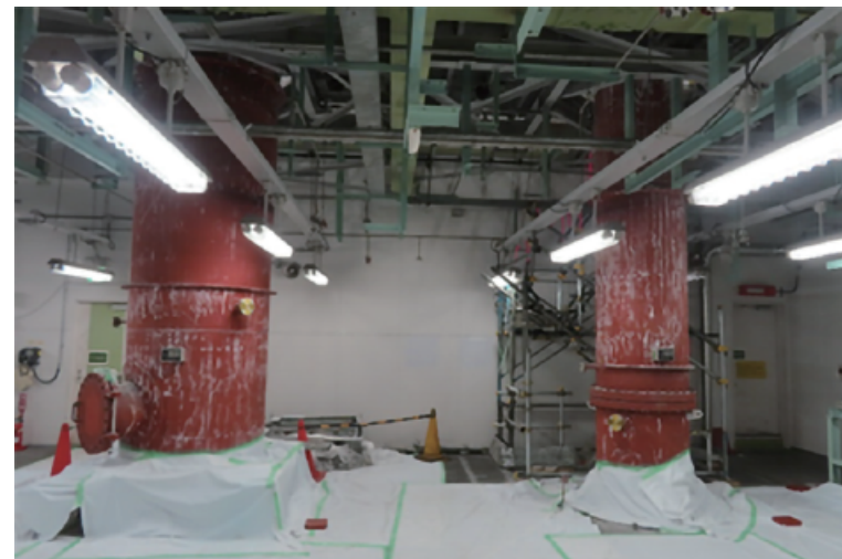
溶剤蒸留回収室 塔保温撤去