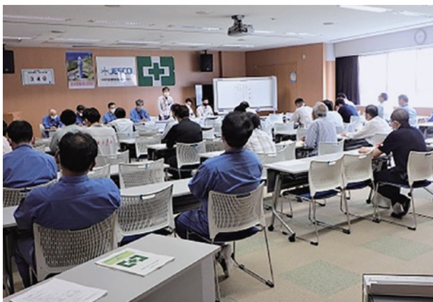
(安全衛生連絡会の様子)

PCB廃棄物処理施設の解体撤去工事を安全確実に施工するため、新たに安全衛生連絡会を設置しました。連絡会は、JESCOと運転会社、解体撤去工事の元請業者及び下請業者で組織し、第1回目を6月28日(水)に開催しました。連絡会では、解体撤去工事の組織体制、施工範囲、工期、JESCO事業所内での作業ルール、安全対策及び現場の管理監督体制等について相互に確認するとともに、元請・下請傘下の作業員にも十分周知するようにしました。