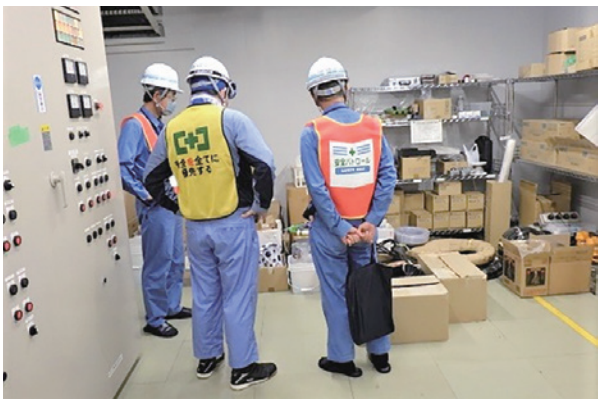
(安全パトロールの様子)