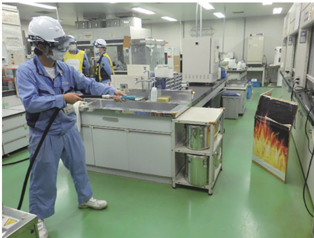
(移動式粉末消火設備の操作訓練の様子)

また、初期消火活動は重要ですが、消火作業中に熱いと感じたら決して無理をせず、その場から速やかに退避することが最優先であるとの教訓も学びました。