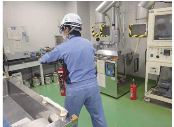
(消火器を使った初期消火訓練の様子)

訓練では、少人数の夜勤者による初期消火活動を中心に、消火器と移動式粉末消火設備の操作方法の習得、併せて消防署への119番通報と公設消防隊の誘導、館内一斉放送および豊田市への緊急通報等の手順を確認しました。