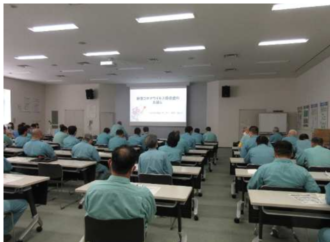
新型コロナウイルス感染症についての安全教育

今後とも新型コロナウイルス感染症などにより、処理に支障が生じないように円滑な操業に努めてまいります。