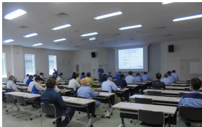
定期点検作業関係者の安全教育

定期点検業務に先立ち、令和 5 年 7 月 18 日には、定期点検に従事する関係会社の社員に対しても、安全教育を実施し、処理に支障が生じないように、確実な定期点検の実施に努めています。