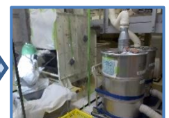
バケット取り外し