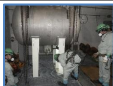
廃アルカリ分解槽（解体前）

廃アルカリ分解槽の取り外しが完了し、養生・搬出が完了しました。その他タンクおよびユニット類は、取り外しが完了し、搬出待ちです。