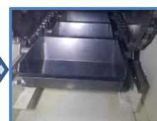
バケットチェーン