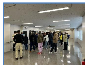
地元自治会の見学者

https://www.jesconet.co.jp/facility/tokyo/about.html