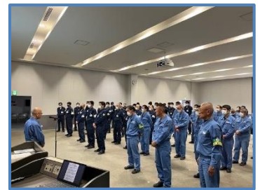
事業所方針所長訓示

処理対象物の確実な処理、運転廃棄物の処理、先行解体撤去の取組等、全てにおいて「安全」を最優先に取組むことを全員で誓いました。