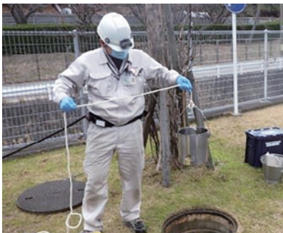
(最終放流口で、排水の採水)