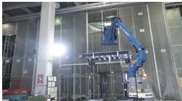
(解体前の立体倉庫全景)

1月27日から、処理棟2階受入エリアにある自動立体倉庫の解体撤去工事を始めました。この倉庫は、多量に搬入されるコンデンサーなどのPCB廃棄物を、自動で搬送保管、PCB廃棄物の処理を計画的に効率よく進めるため、倉庫から搬出してPCBの無害化処理を進めるための設備でした。