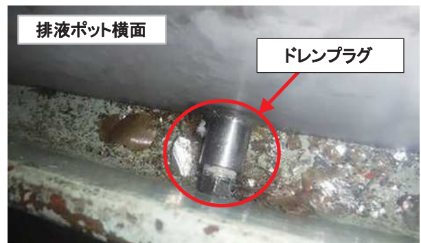
奥の排液ポットと手前の枠の間の状況 (左写真の青矢印方向から撮影)