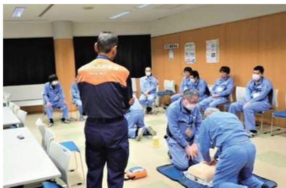
(交代しながら胸骨圧迫を訓練する様子)

当事業所は万が一に備えAEDを設置しており、所員はAEDの操作や心肺蘇生を適切に行えるように、普通救命講習を2年ごとに受講しています。