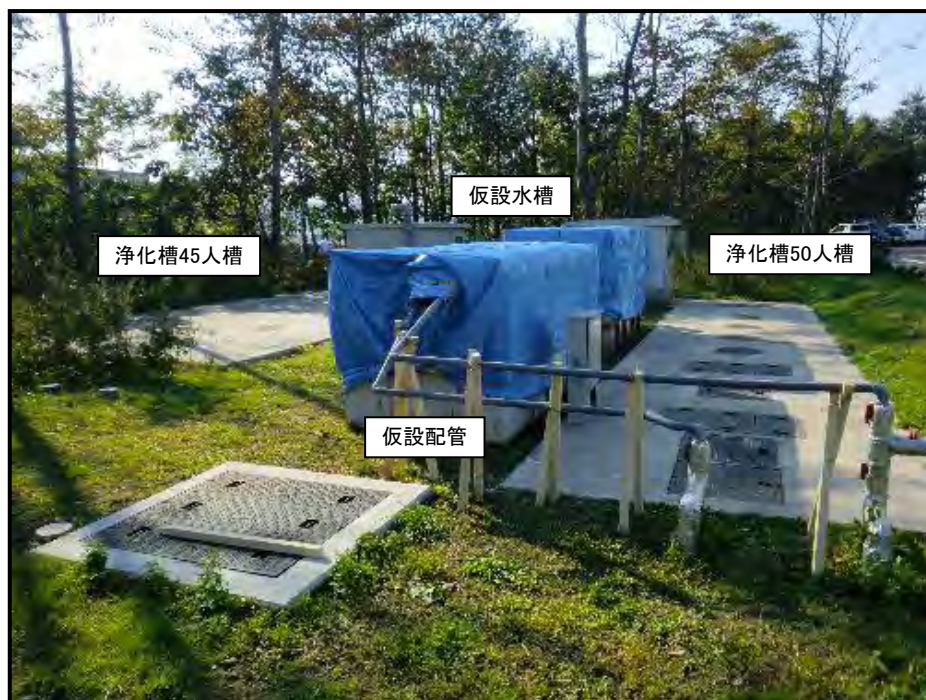
浄化槽及び仮設配管等の設置状況