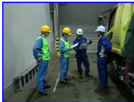
受入時検査の様子