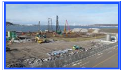
写真上 工事が始まった増設現場