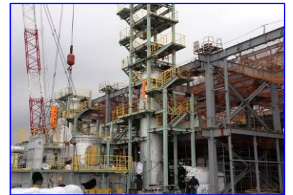
設備の据え付け状況

平成23年度の工事は冬期に開始したため厳しい条件下での施工になりましたが、低温や強風などに対策を取りながら安全・確実に作業を行ってまいりました。