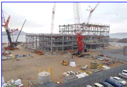
当初施設4階より増設工事現場を見たところ