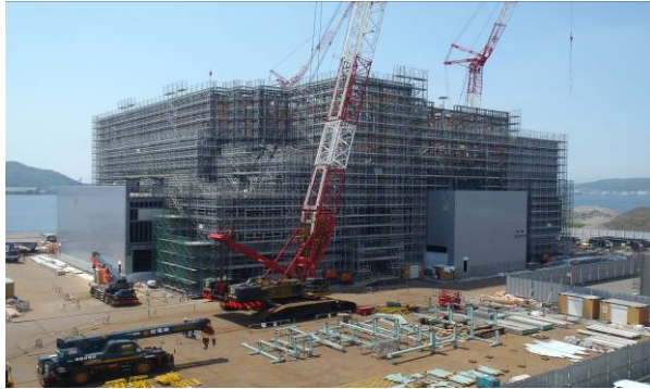
当初施設4階より増設工事現場を見たところ (外部には足場が組まれ、一部外壁も貼られています)

7月1日から7日まで『ルールを守る安全職場 みんなで目指すゼロ災害』をスローガンに安全に対する意識と職場の安全活動のより一層の向上に取り組む「全国安全週間」でした。