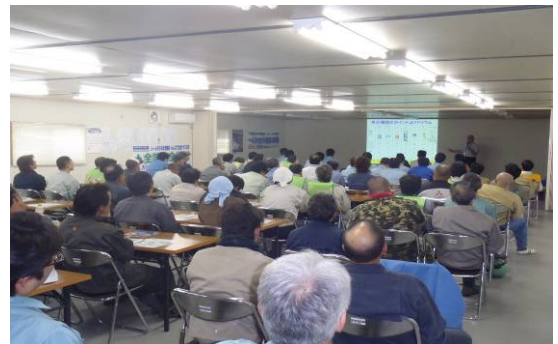
大塚製薬株式会社による熱中症講話

プラント工事は引き続き、機械装置の据え付けを行っていますが、その他電気工事、配管工事や換気空調工事など、建築工事と調整を取りながら行っているところです。