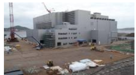
当初施設4階より増設工事現場を見たところ (外壁が貼られ、手前は敷鉄板を剥がし外構工事準備中)

また外壁など建物の外部の施工が概ね完了したので、側溝や舗装などの外構工事にも着手しています。