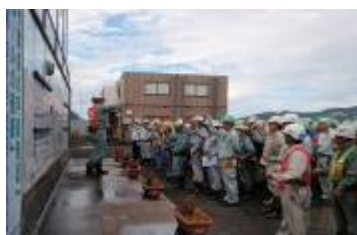
安全大会安全コール

10月は、1日から7日まで『心とからだの健康チェック みんなで進める健康管理』をスローガンに、働く人の健康の確保・増進を図り快適に働くことができる職場づくりに取り組む「全国労働衛生週間」でした。この増設事業の現場においても、意識の高揚を図るため安全大会で訓示が行われました。年明けからの試運転を前に、より一層安全な建設に向けて安全パトロールの強化など作業員一丸となって取り組み、安心・安全な設備の建設に努めてまいります。