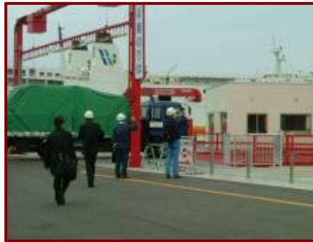
フェリーによる道外品搬入(H20.10.24)