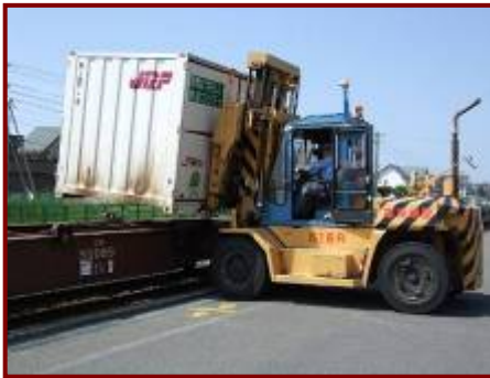
JRによる道外品搬入(H20.7.7)