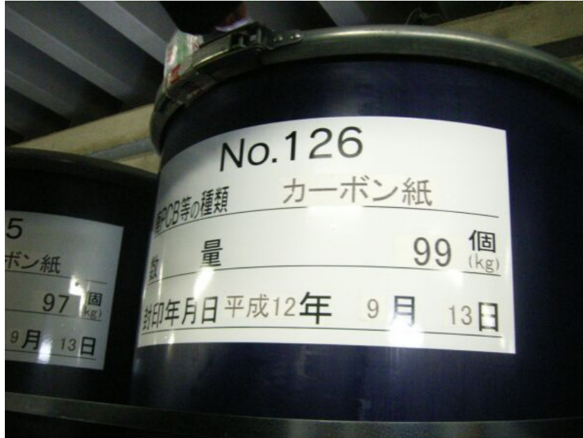
写真⑦ 感圧複写紙を保管しているドラム缶