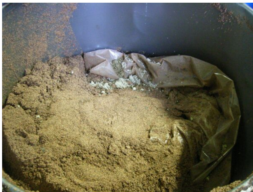
写真⑪ 汚泥（酸性白土（顆粒状））