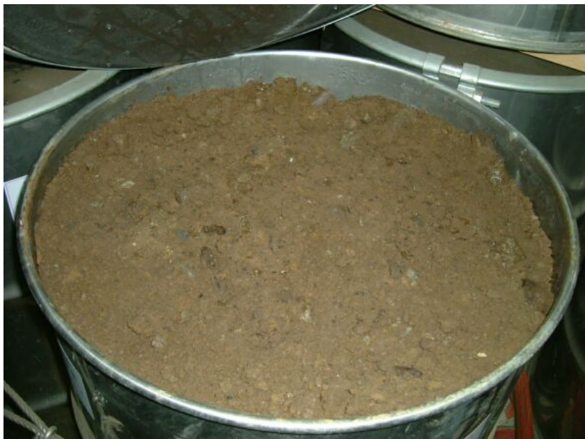
写真⑩ 汚泥 (屋外で作業中にトランスから PCB 油を漏洩させたため、周辺汚泥を保管)