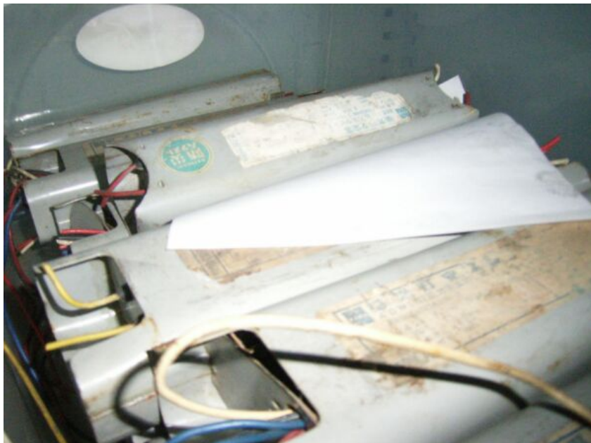
写真④ 水銀灯用安定器