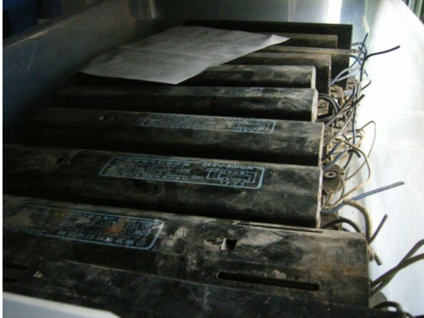
写真③ 蛍光灯用安定器