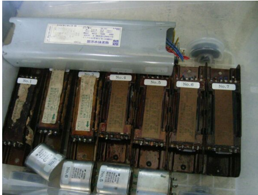
写真⑤ 安定器のコンデンサ (同番号の安定器から取り外したもの)