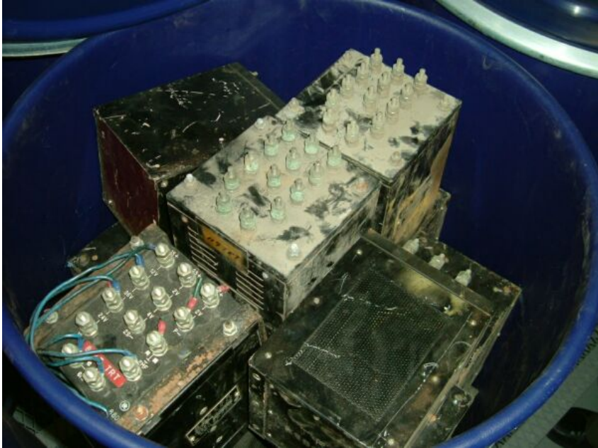
写真① 小型電気機器（継電器）