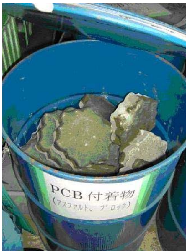
写真⑫ 汚泥（舗装用ブロック）