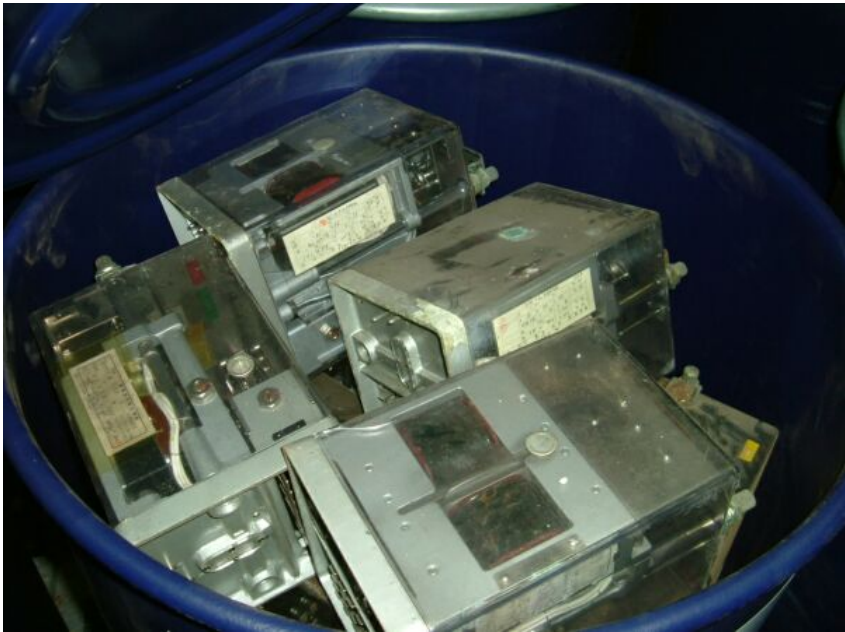
写真② 小型電気機器（継電器）