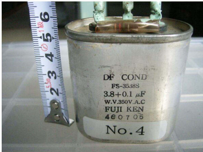
写真⑥ 安定器のコンデンサ