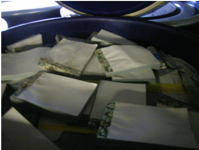
写真⑧ ドラム缶内の感圧複写紙