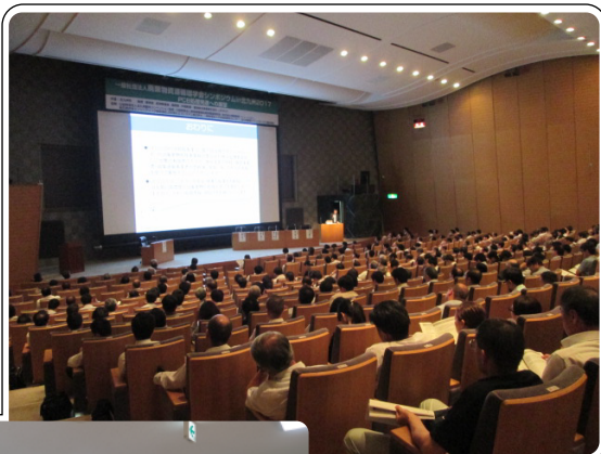
シンポジウム会場

翌26日(水)シンポジウム出席者を対象に北九州PCB処理事業所の見学ツアーを企画し、37名の方が参加されました。