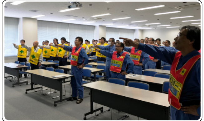
全員で安全スローガンを唱和する

安全を最優先に作業を進め、9月8日をもって無災害で今年の定期点検を完了致しました。