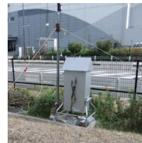
事業所敷地内での測定の様子 (写真はエアサンプラー)

また、平成25年12月に実施した施設からの排気、排水中のPCB、ダイオキシン類等のモニタリング調査でも、全ての場所における測定値が自主管理目標値等を下回っていました。