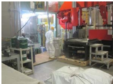
【横型バンドソーを監視している状況】

再発防止策として、個人に支給している化学防護長靴のサイズを再確認し、ちょうど良い長靴を使用することや、レベル3区域内の段差部分には注意を喚起するため危険表示の黄色と黒色の縞模様のテープを貼付する等の対策を実施しました。