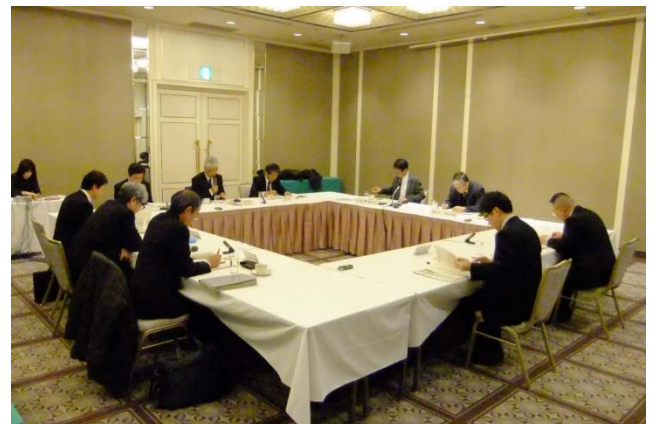
大阪 PCB 処理事業部会の様子

今回は、大阪 PCB 処理事業所の「操業状況」、「長期保全計画策定」及び「内部技術評価結果」について報告しました。各委員から、作業環境測定結果や真空加熱分離装置のトラブル、並びに施設の長期保全計画について専門的なご意見をいただきました。これらのご意見を踏まえて課題に取り組み、安全・確実な処理事業を進めてまいります。