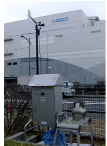
事業所敷地内での測定の様子 (風向・風速計とエアサンプラー)

また、平成26年6月に実施した施設からの排気、排水中のPCB、ダイオキシン類等のモニタリング調査でも、全ての場所における測定結果が自主管理目標値等を下回っていました。