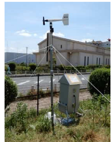
事業所敷地内での測定の様子 (風向・風速計とエアサンプラー)

また、令和元年5月から7月に実施した排出源モニタリング調査（施設からの排気、排水中の PCB、ダイオキシン類等の濃度測定）においても、全ての測定点で自主管理目標値を下回っていました。