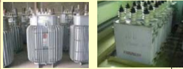
高圧トランス 高圧コンデンサ