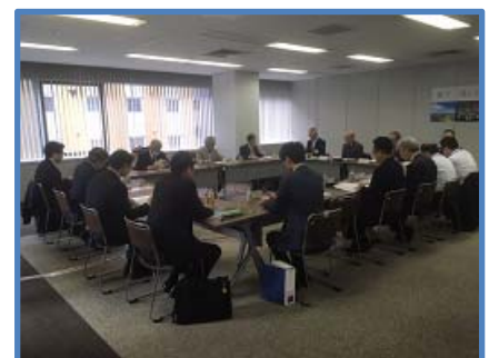
東京 PCB 処理事業部会