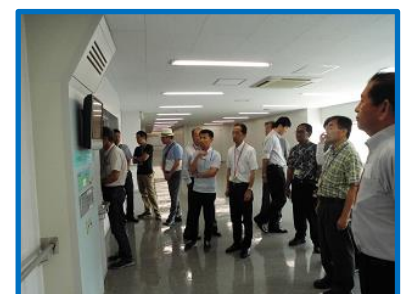
スーパーエコタウン見学