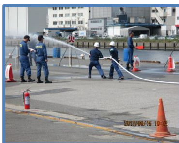
屋内消火栓操法の実演