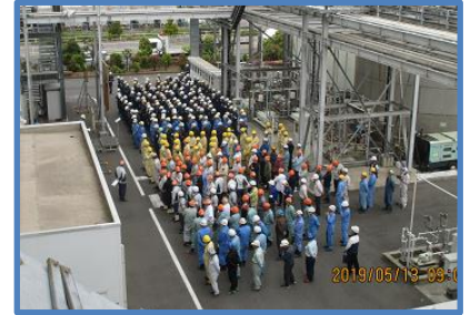
定期点検安全大会

JESCO 社員及び運転会社社員、点検・整備にあたる工事請負会社などの関係者が集合し、JESCO 所長による安全訓示、工事請負責任者による安全宣言などで、注意喚起と安全意識の高揚を図りました。