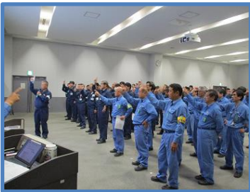
安全週間安全大会

全国安全週間（7月1日～7日）を迎えて、7月1日に JESCO 社員及び運転会社社員による令和元年度安全大会を開催しました。