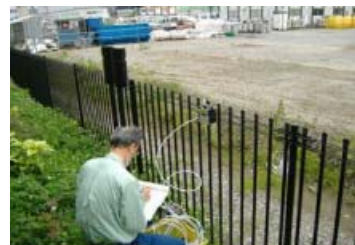
環境中のPCBの濃度測定 施設北側敷地境界

敷地境界(東西南北)の大気中PCB濃度の測定も行いましたが、いずれの測定地点におきましても検出下限値(0.0005mg/m 3 )未満でした。この測定結果から施設周辺の環境への特段の影響はないものと考えられます。