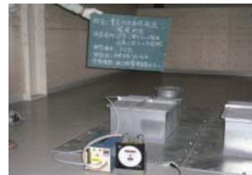
排気中のPCBの濃度測定 3Fコンデンサ解体グローブボックス系統排気

コンデンサ解体室の予備洗浄ユニット系統及びグローブボックス系統排気口において、5月26日、排気停止前にサンプリングし、公定法により分析した結果、PCB濃度は最大0.20mg/m 3 Nでした。この値は、環境保全協定に基づく自主管理目標値(0.01mg/m 3 N)を超過していました。