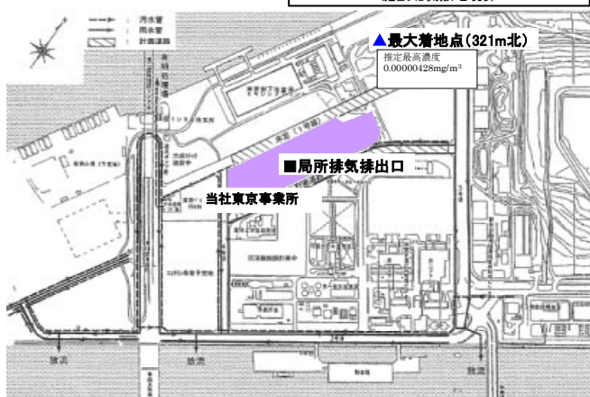
大気拡散式によるPCB濃度シミュレーション

この最高濃度は、「PCB等を焼却処分する場合における排ガス中のPCB暫定排出許容限界について」(昭和47年環大規第141号)に示された環境大気目標値の0.0005mg/m 3 を十分下回っておりました。