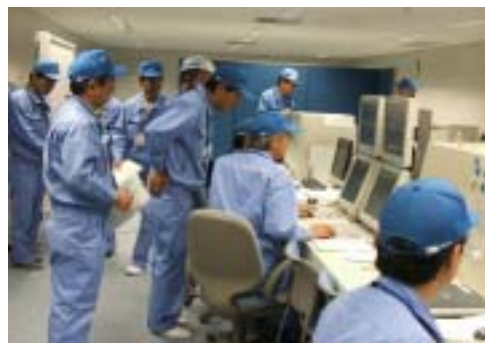
中央制御室における 緊急時・異常時訓練の状況