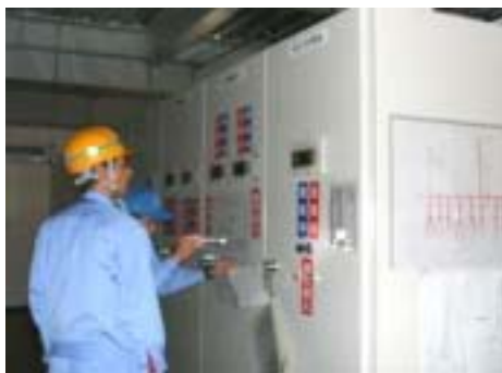
停電時訓練の状況