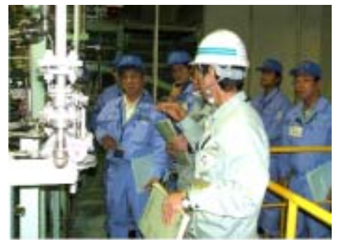
新規運転員教育の状況