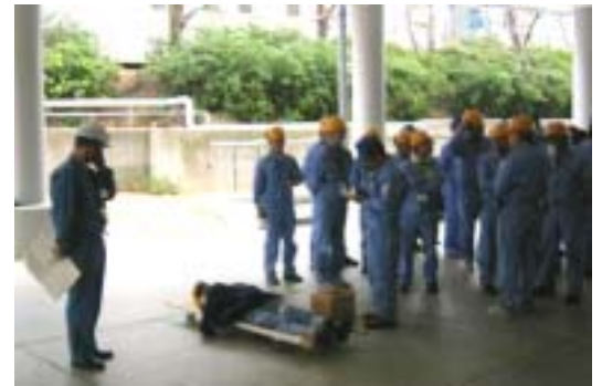
地震時訓練の状況

今後の試運転で設備を動かして教育と訓練を重ねていき、二度と人為的なミスを起こさないよう徹底していきます。