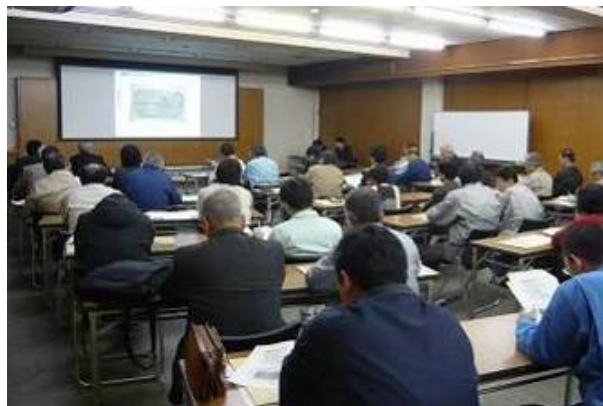
蒲郡市における説明会の様子

弊社では、PCB廃棄物の少量保管事業者の方々を対象に、受け入れる地域から順次『PCB廃棄物処理説明会』を開催しています。