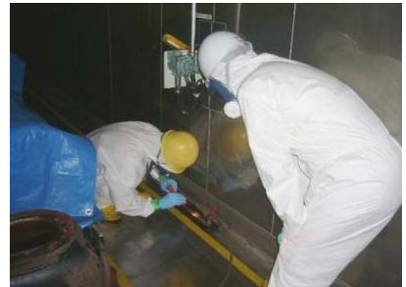
遮蔽フード内の点検(発泡試験)