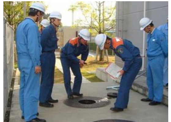
豊田市消防本部による地下タンク貯蔵所の立入検査

危険物の取り扱いによるトラブルを発生させないよう、今後も危険物の安全な管理と適正な取扱いを行ってまいります。