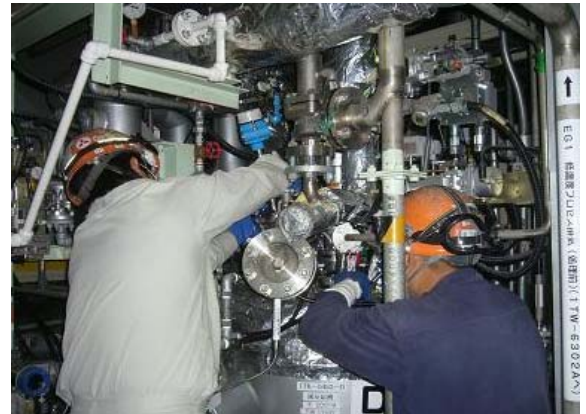
真空加熱エリア内(副反応槽)の点検