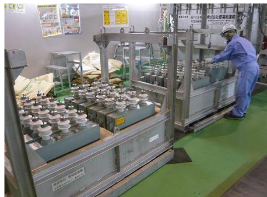
受け入れたコンデンサ

今月号の運転状況の紹介として、処理エリア内に受け入れたコンデンサと受け入れたコンデンサを一時的に保管する立体倉庫の写真を掲載しました。