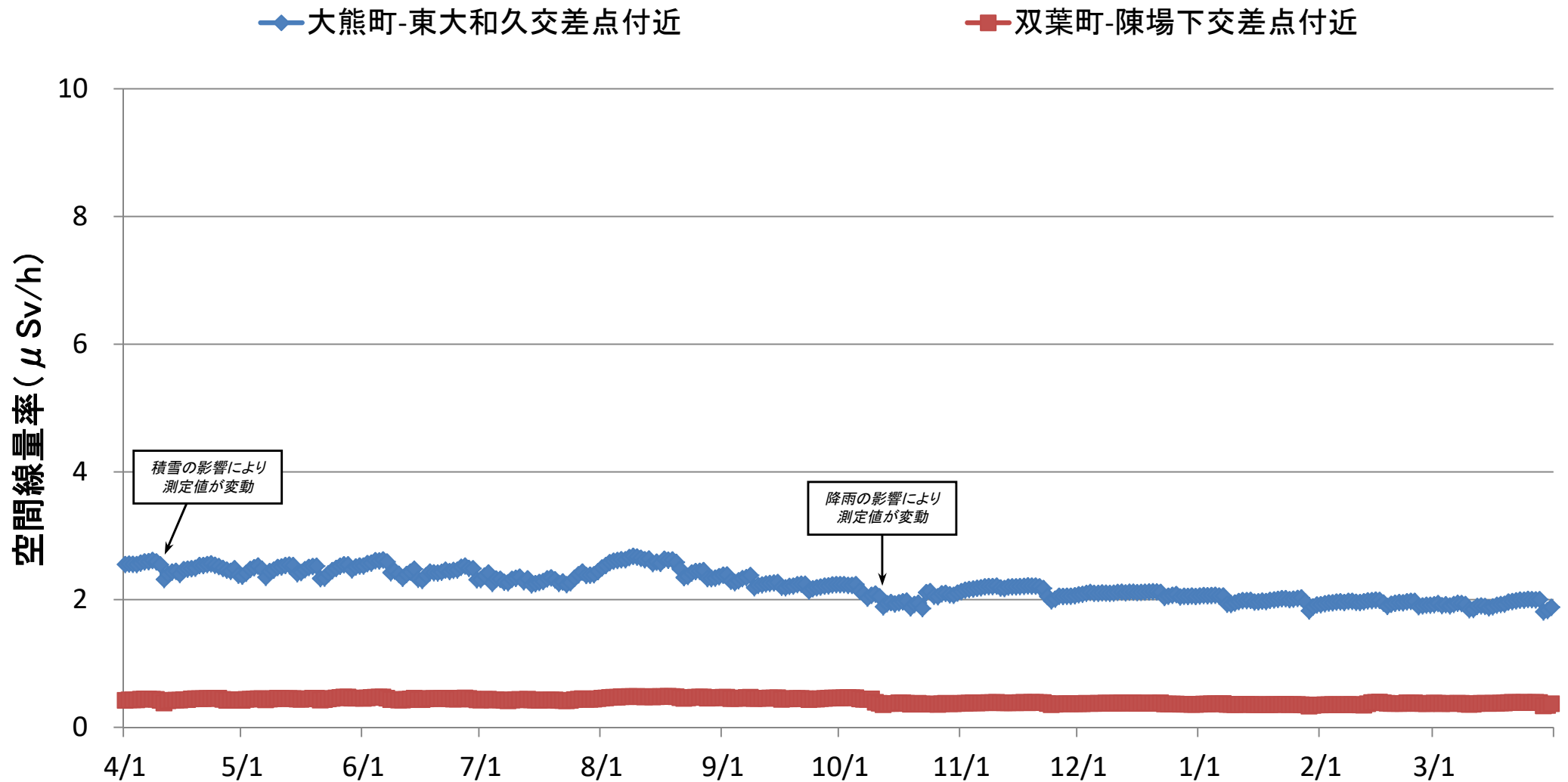
中間貯蔵施設区域境界における空間線量率の推移(連続測定) (2019年4月1日～2020年3月31日)